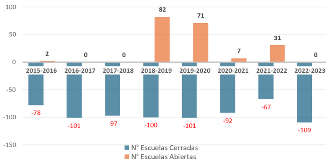
Gráfico N°2: Variación de Establecimientos Escolares en Chile