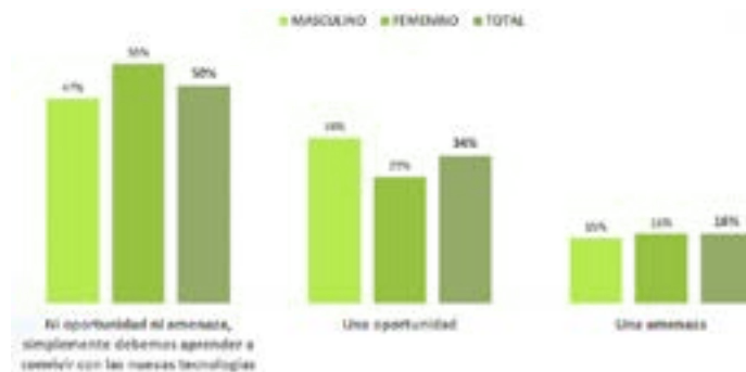
Gráfico N°2: ¿Al pensar en Inteligencia Artificial Generativa o ChatGPT, usted lo ve cómo?