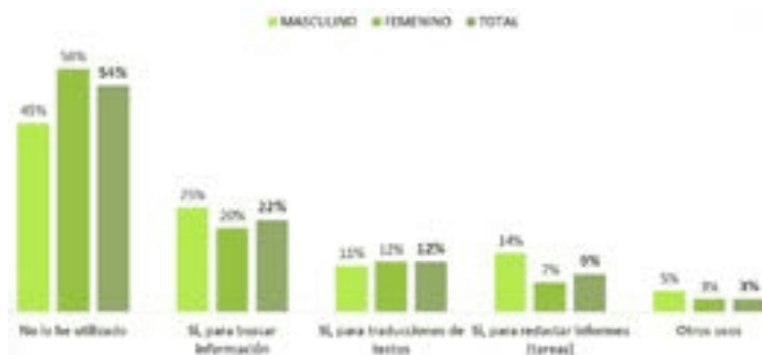
Gráfico N°6: ¿Ha utilizado Chat GPT u otra herramienta de inteligencia artificial para fines educacionales tales como tareas y trabajos en ramos?