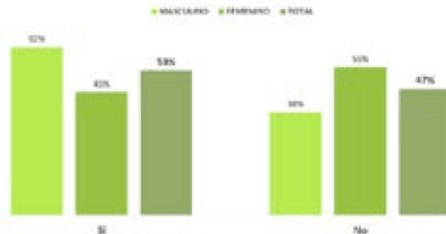
Gráfico N°1: ¿Ha escuchado hablar de CHAT GPT basado en inteligencia artificial y el uso que se le está dando?