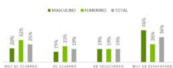
Gráfico N°4: ¿Considera adecuado cerrar los establecimientos educativos por la ocupación de los espacios públicos en el desarrollo de los narcos funerales?