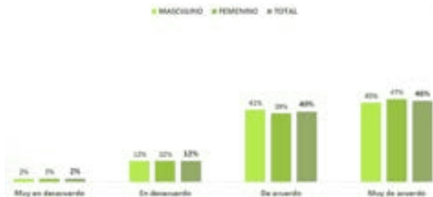
Gráfico N°4: A partir de la pandemia he valorado más la labor docente