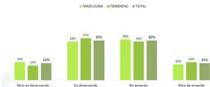
Gráfico N°1: ¿El sistema educativo chileno ha mejorado en la última década?