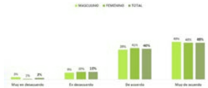
Gráfico N°3: El aporte de los profesores a la sociedad es más importante que la contribución de otros profesionales