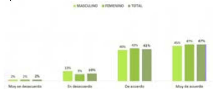
Gráfico N°5: Los profesores han sido clave para promover el bienestar socioemocional de los niños en el retorno a la presencialidad